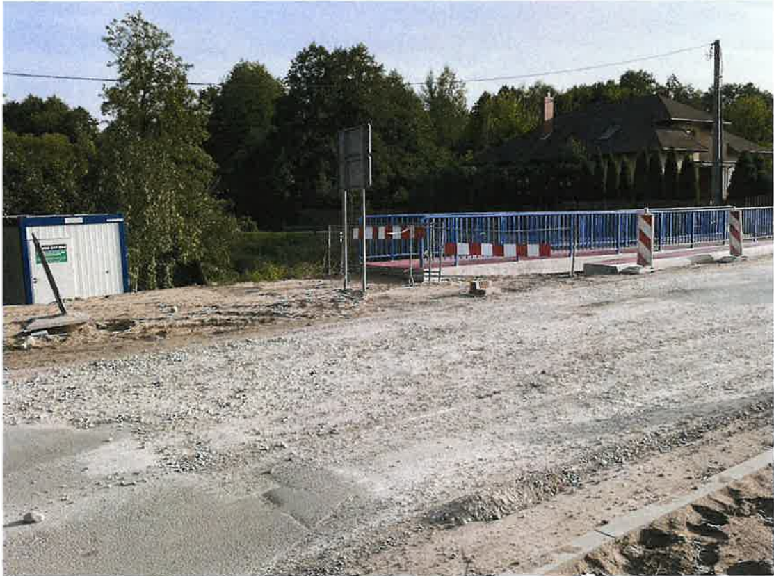
Kładka dla pieszych w kier. Olimpina – strona lewa