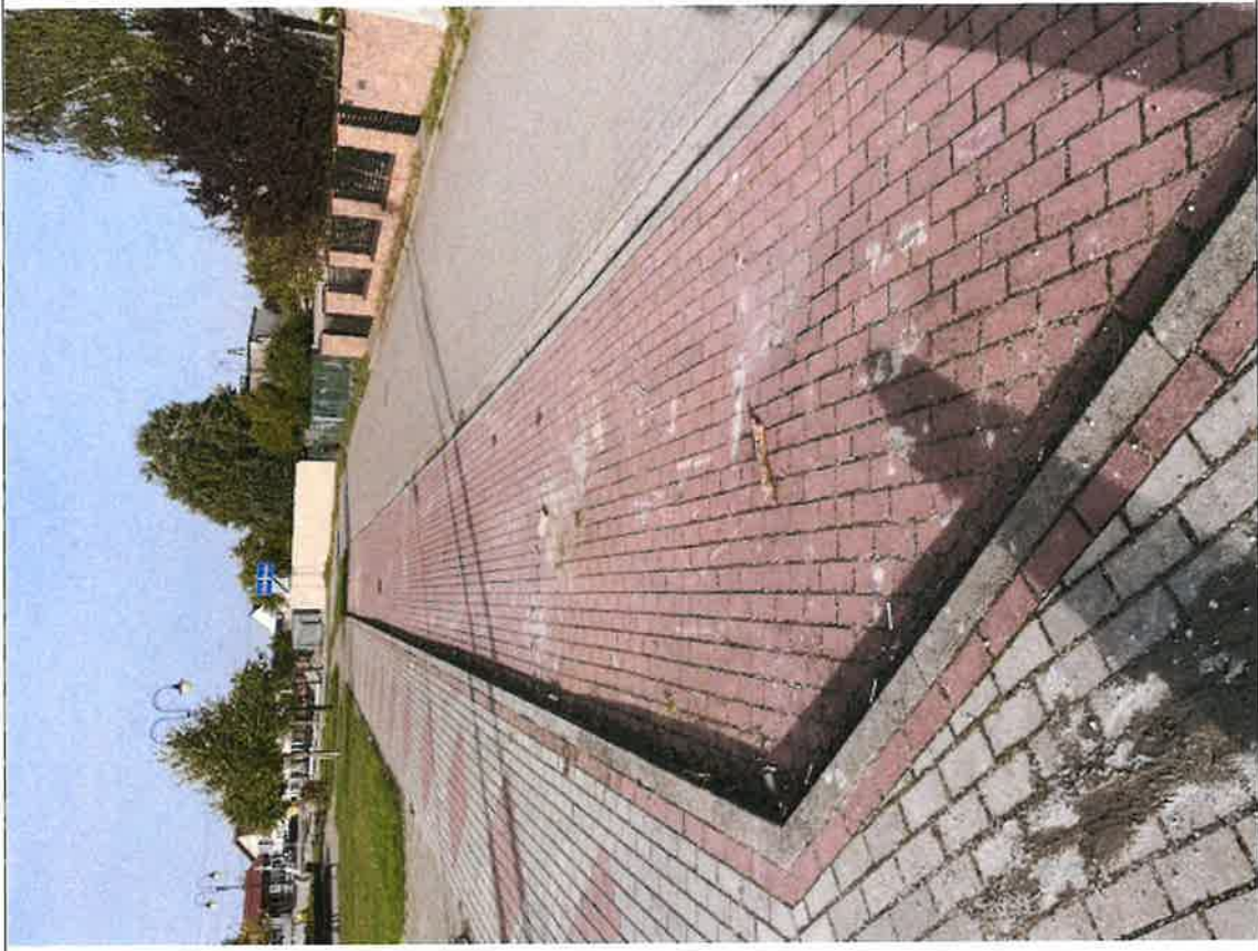
Brzoza ulica Szkolna po składowaniu kostki