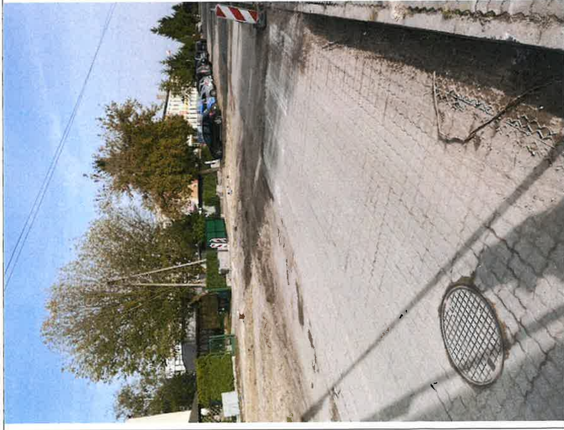
Brzoza – wjazd w ul. Powstańców Wielkopolskich kier. południowy