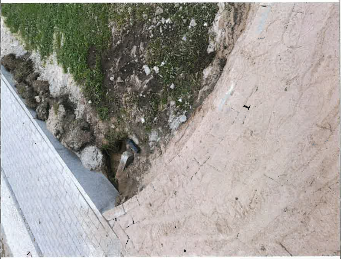
Brzoza – skwer centrum