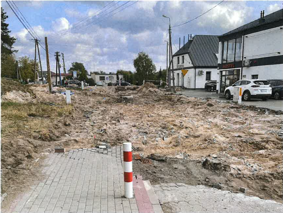
Skrzyżowanie DW254 z drogą gminną – ul.Powstańców Wielkopolskich w kierunku Przytek – rozkopana i zamknięta od lipca