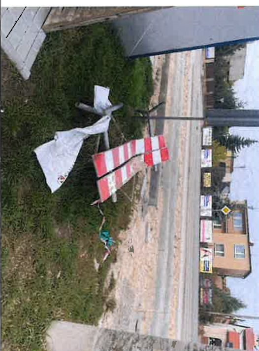
Składowanie materiałów na terenach prywatnych (pawilony handlowe)