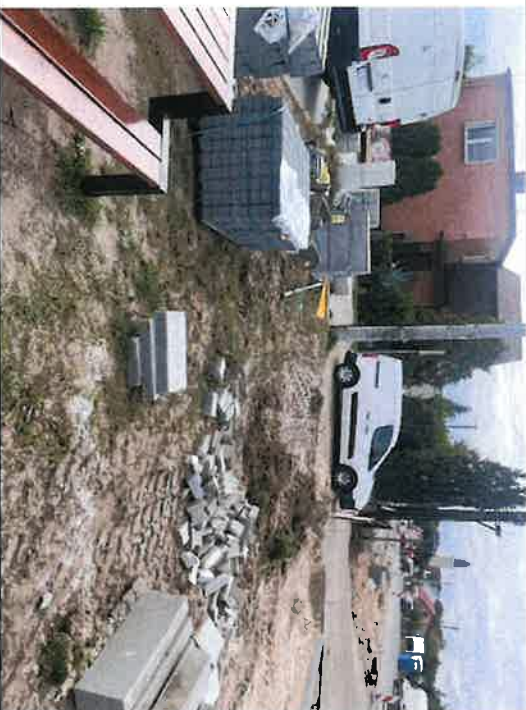
Składowanie materiałów na terenach prywatnych (pawilony handlowe)