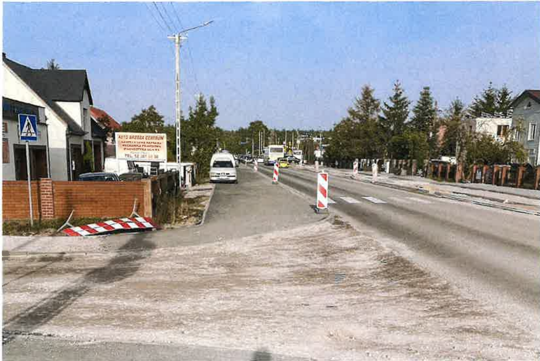
Skrzyżowanie DW254 z drogą gminną ul.Przemysłowa