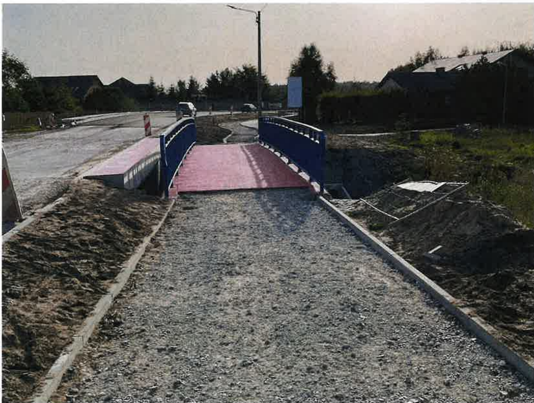
Chodnik w kierunku Olimpina