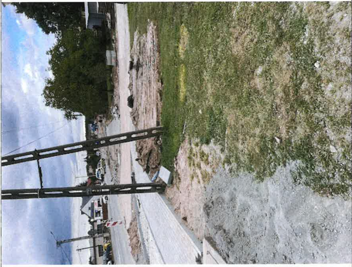
Brzoza – skwer centrum