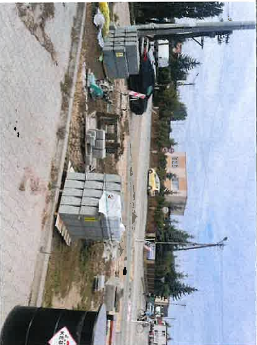
Składowanie materiałów na terenach prywatnych (pawilony handlowe)