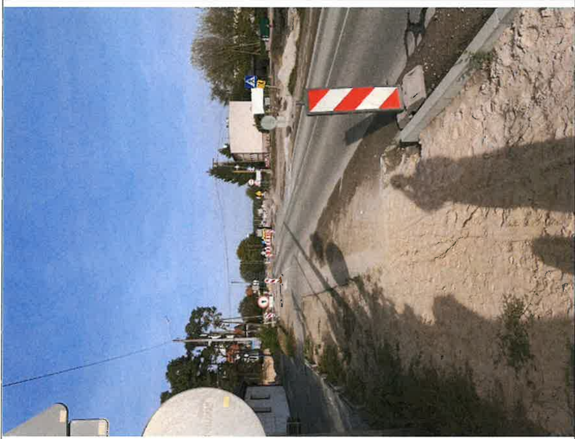
Chodnik w kier. Olimpina