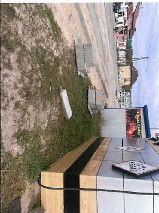
Składowanie materiałów na terenach prywatnych (pawilony handlowe)