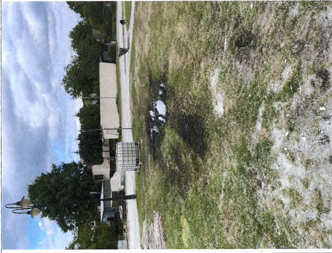
Brzoza – skwer centrum